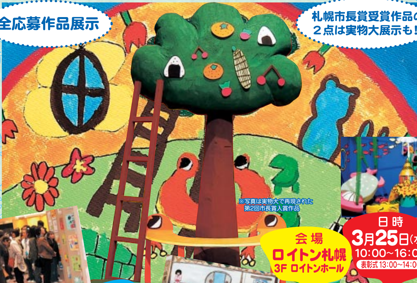
※写真は実物大で再現された 第2回市長賞受賞作品